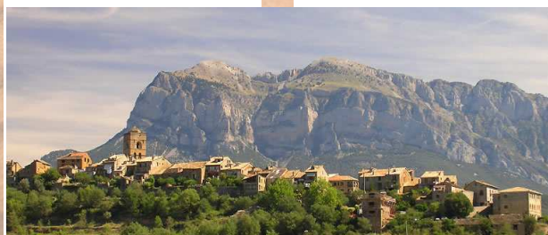
Le village d'Ainsa (Espagne, Aragon)