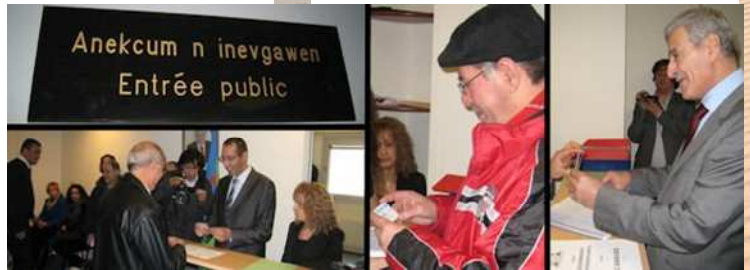
Délivrance des premières cartes d'identité kabyle

jour d'historique. Au nom de l'Anavad, il appela tous les Kabyles à s'acquitter de la carte d'identité kabyle. « Cette carte, dit-il est notre fierté ; elle augure d'autres initiatives beaucoup plus prometteuses ». Il ajoute que « Aujourd'hui, on est entre nous, demain on aura notre place parmi les nations » avant de conclure sous un tonnerre d'applaudissements par « que vive le peuple kabyle, que vive le Gouvernement kabyle ».