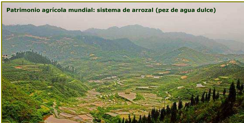
Patrimonio agrícola mundial: sistema de arrozal (pez de agua dulce)